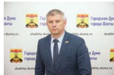
ВИТАЛИЙ ФОМИН, ПРЕДСЕДАТЕЛЬ КОМИТЕТА ПО СОЦИАЛЬНОЙ ПОЛИТИКЕ:

Большое внимание депутатский корпус уделяет взаимодействию с жителями в социальных сетях как форме формирования о своей деятельности. Коллеги ведут личные аккаунты в популярных мессенджерах, фактически общаясь в онлайн-формате с населением в круглосуточном режиме. Это позволяет помогать людям оперативно и адресно.