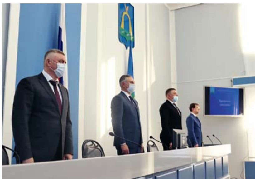
Заседание Батайской городской Думы

Индекс промышленного производства составил 121,4%, отгрузки товаров – 115,9%. По состоянию на