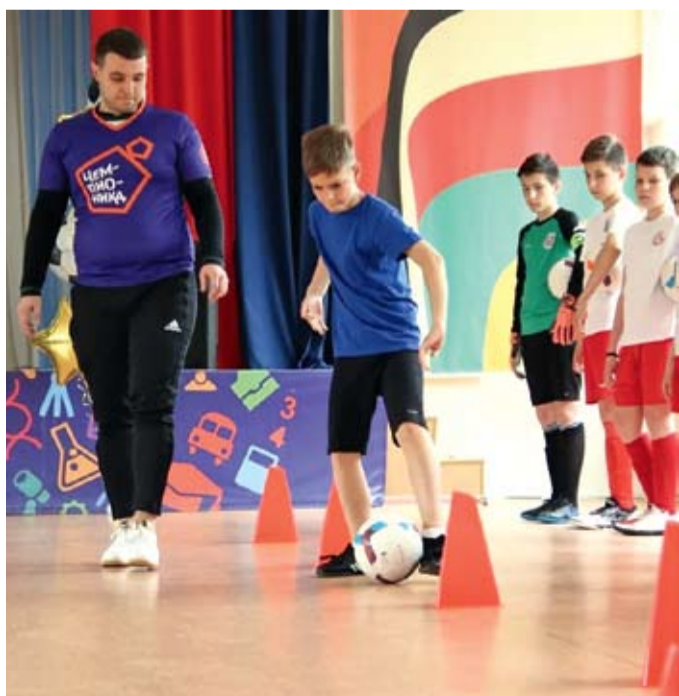
На занятиях секции адаптивного футбола.

– Эта проблема появилась давно, и долгое время ее решение не могло найти отражение в конкретных законодательных актах, предусматривающих необходимое финансирование. Оздоровление Дона, в первую очередь, актуально для меня как для жителя Ростовской области. Думаю, нет ни одного равнодушного к этой теме ростовчанина. Вопросы экологии выходят сейчас на ведущие позиции. Мир осознал необходимость сбережения природы и сохранения ее для будущих поколений. Сегодня у нас это понимание совпадает не только с необходимостью, но и с возможностями. Работы по оздоровлению донского бассейна будут системными, комплексными и вестись с большим объемом финансирования. Это строительство очистных сооружений, расчистка русел малых рек, реконструкция водоподводящих и канализационных сетей. Большой плюс получит и Ростов-на-Дону в решении давней проблемы с ливневками. Поэтому реализация данной программы во всех аспектах будет иметь только положительное значение.