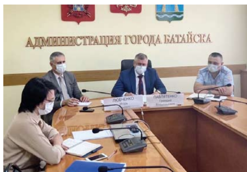
Заседание Батайского городского штаба по борьбе с коронавирусом

Одним из магистральных направлений работы муниципалитета яв-