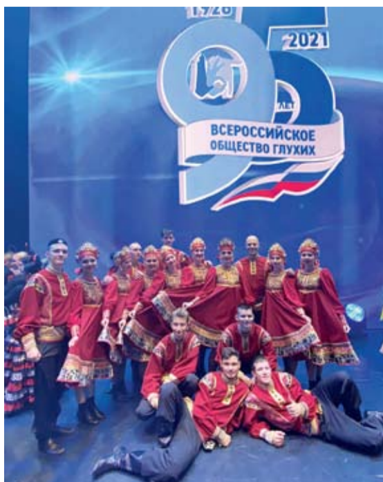
Делегация из Ростовской области на концерте Всероссийского общества глухих в Кремле.